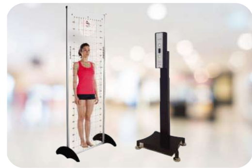
全身姿態分析檢查