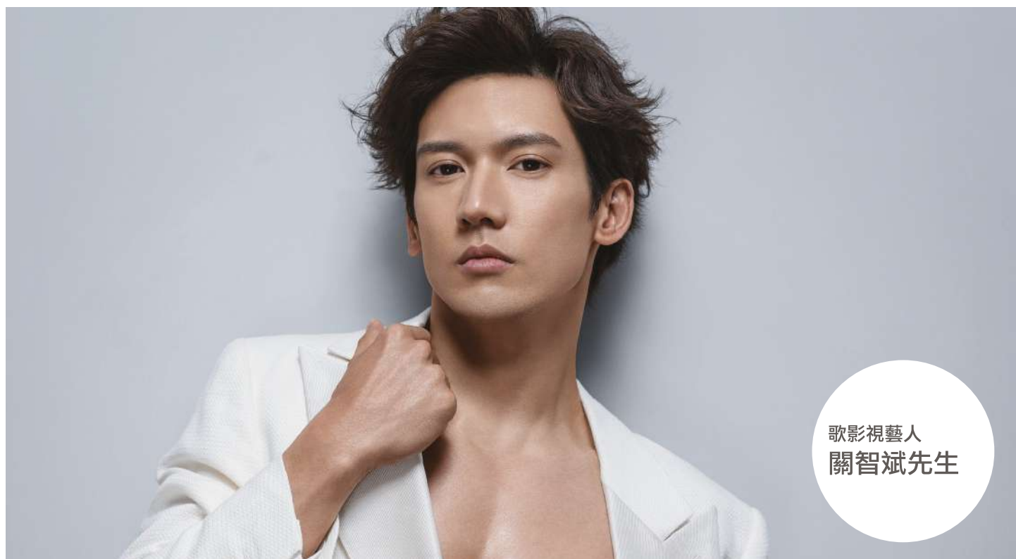
歌影視藝人 關智斌先生