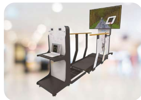
步態動態分析檢查