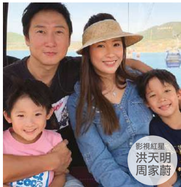
影視紅星 洪天明 周家蔚