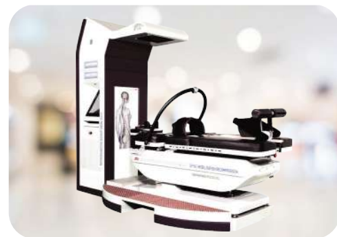
Spine MT 全脊椎減壓治療